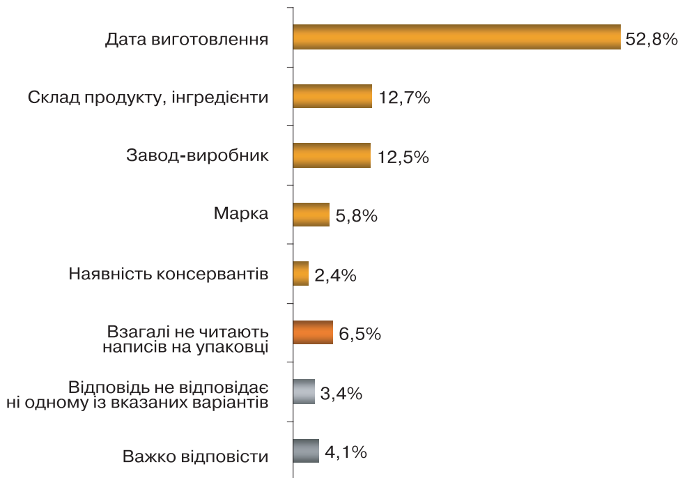
Діаграма 3. КУПУЮЧИ МОЛОЧНІ ПРОДУКТИ, ЯКУ ІНФОРМАЦІЮ НА УПАКОВЦІ ВИ ЧИТАЄТЕ В ПЕРШУ ЧЕРГУ?

Інформація про проект: дослідження проводилося на замовлення журналу «МОЛОЧНА ПРОМИСЛОВІСТЬ» компанією InMind – Factum Group в період з 24 до 31 січня 2007 року методом телефонного інтерв'ю. Об'єм вибірки: 400 респондентів у віці від 16 років і старше. Вибірка випадкова із бази міських номерів м. Києва. Параметри демографічного профілю респондентів: вік, стать, сімейний стан, освіта, доходи. Теоретична похибка вибірки не перевищує 5%.